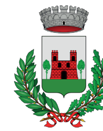
Comune di Inverigo