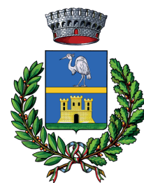
Comune di Airuno