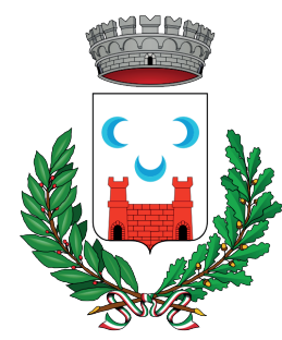
Comune di Calco